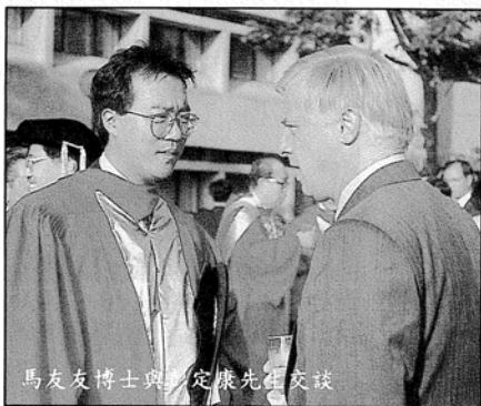
馬友友博士與彭定康先生交談