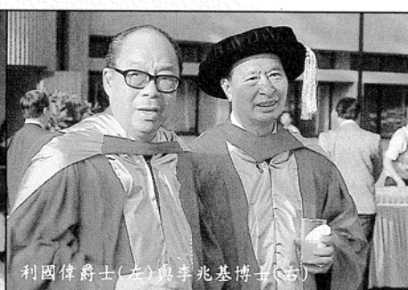
利國偉爵士(左)與李兆基博士(右)

本校於上月十四日假邵逸夫堂舉行第四十六屆頒授學位暨三十周年校慶典禮，由港督兼大學監督彭定康先生主禮。