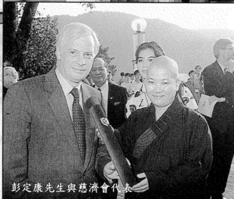
彭定康先生與慈濟會代表

當天觀禮嘉賓逾八百五十人，包括海內外院校代表近八十人。典禮結束後，大學於科學館外設茶會招待嘉賓，彭定康先生更與來賓親切交談，氣氛融洽。