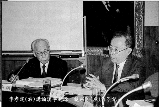
李孝定(右)講論漢字起源，饒宗頤(左)作副記

本校中國語言及文學系上月廿八至三十日舉辦第二屆國際中國古文字學研討會，六十多位國內外學者在會上交流彼此對古文字研究的心得。會議在祖堯會議廳舉行，為本校三十周年校慶活動之一。