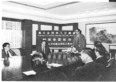
負責人，主持美國社會科學研究院等中國研究委員會，歷任美國耶魯大學、

陳教授早年畢業於香港大學，後負笈美國普林斯頓大學，獲博士學位，為中國元、明史學者，著作甚豐。陳教授曾多次出任華盛頓大學亞洲研究