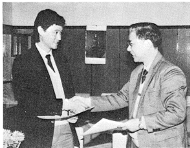
香港生物科技研究院在協作計劃中，除提供專門知識和拓展產品市場外，並負責為上海分院培訓行政及管

中國科學院上海分院共設有十五個研究單位及一個文獻情報中心，聘用專業科技人員超過一萬一千名，從事基礎研究及應用研究工作，成就卓越。