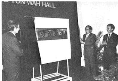
國語文研習所使用，為該所師生提供更多教學設施及康樂活動場地。

方潤華堂乃方樹泉樓之擴建新樓，面積約二百八十二平方米，由方樹福堂基金會捐資興建，專供新雅中