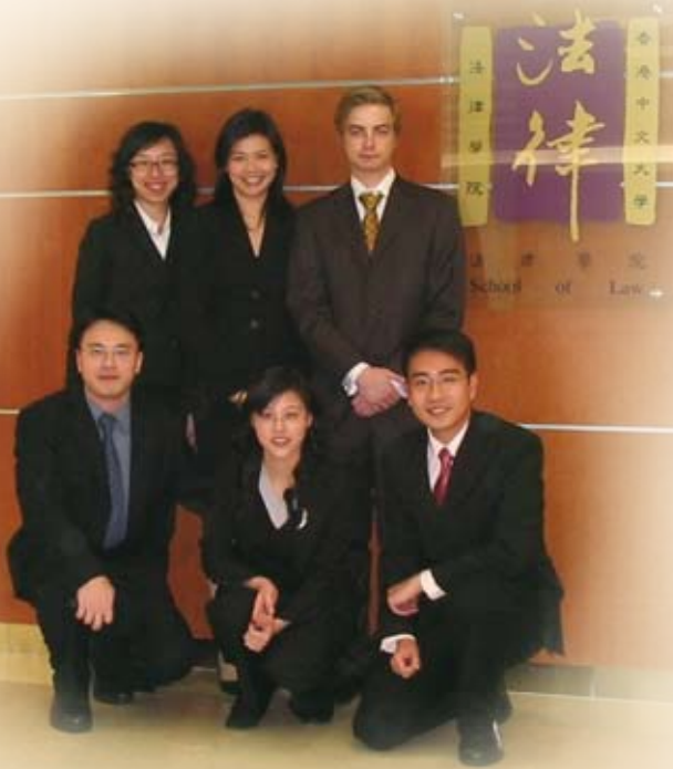
參加維斯國際商事模擬仲裁比賽（東方賽區）的中大隊伍

法律學院會精益求精，循序漸進地開辦一些新課程，而第一個會是二零零八年九月開辦的法學專業證書課程。這個嶄新的課程，得到香港大律師公會和香港律師會的支持，招生準則是貴精不貴多。