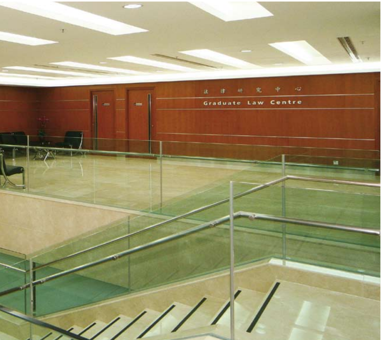
位於中環的法律研究中心

學院立志成為研究型的法學院，並為有關法律改革的政策討論作出貢獻。學院的教學人員從事重要的研究計劃，發表的著作更提出嶄新的理論和觀點。由此奠下的堅實基礎，有利於他們與各地大學的法律研究者展開合作，並能促進教職員和學生與世界一流學府的交流。