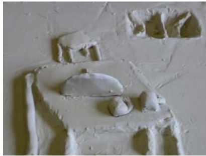
圖二：浮雕試作（學生作品）

從以上對話，不難發現學生對自己信心不足。研究者請女生澄清「方向」是指甚麼時，她表現得畏縮；但當研究者說「對」，她即時表現興奮的說：