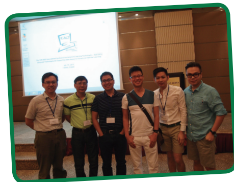
The 14th IEEE International Conference on Advanced Learning Technology (ICALT 2014) at Athens, Greece