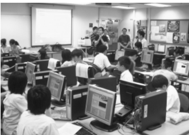
33 secondary students with outstanding performance competing with each other in the final competition of Farmtasia II

CAITE conducted a project entitled "Immersion Learning with Farmtasia II in Liberal Studies for Junior Secondary Students" during March and August 2009. It aimed at developing students' problem-solving ability, fostering their habit of critical thinking and solving problems proactively. Totally 11 secondary schools participated in the project. More than 800 secondary students joined the project. At the end of the project, 33 students with outstanding performance were invited to take part in the final competition in July. The winners were presented with awards, certificates and prizes in the closing ceremony in September 2009.