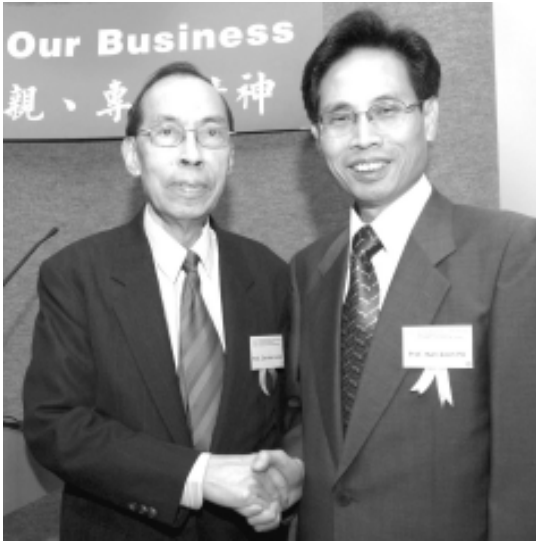
梁子勤教授與何萬貫教授合照：在香港兒童腦科及體智發展學會的演講上分析研究成果