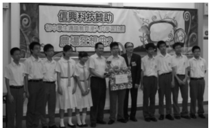
Presentation of awards and prizes in the closing ceremony of Farmtasia II to the winning school of the final competition, Po Leung Kuk Wu Chung College