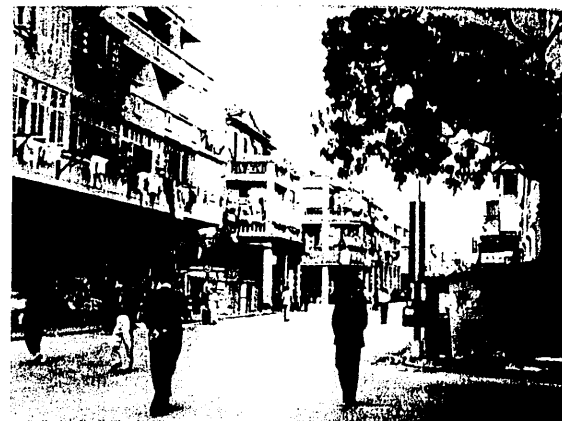
1949年桂林街校舍外觀

學生來源則多半為大陸流亡之青年，尤以調景嶺難民營中來者佔絕大比數。彼輩皆不能繳學費，更有在學校天台上露宿，及蟻臥三四樓間之樓梯上者。遇余晚間八九時返校，樓梯上早已不通行，須多次腳踏襪被而過。或則派充學校中