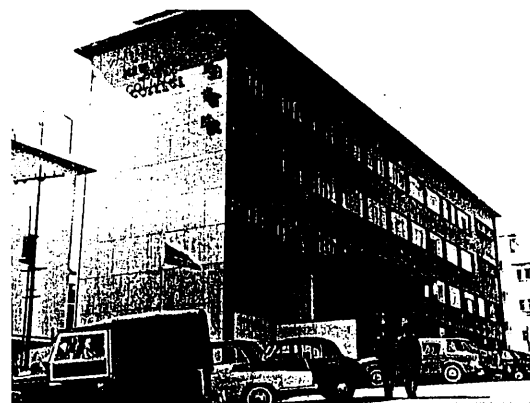
1956 年農圃道校舍外觀

新亞研究所在先不經考試，只由面談，即許參加。或則暫留一年或兩年即離去，或則長留在所。自獲哈燕社協款，始正式招生。不限新亞畢業，其