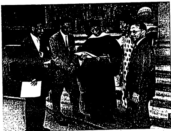
1960年錢穆教授獲耶魯大學頒授榮譽博士學位

富爾敦亦特來邀余夫婦去其家住一宵。火車路程一小時即達，午後討論香港創辦新大學事，談及校長問題，兩人仍各持舊見，不相下。出至郊外，參觀在此興建一大學之新校址，彼即預定任此校之校長。晚餐後，續談香港新大學校長問題，仍不得解決。翌晨再談，仍無結果。午後，富爾敦親送余夫婦返倫敦。車上仍續談此問題。余問，當前中國學人君意竟無堪當一理想大學校長之選否。富爾敦色變，遽謂此問題當依尊旨，即此作決定，幸勿再提。