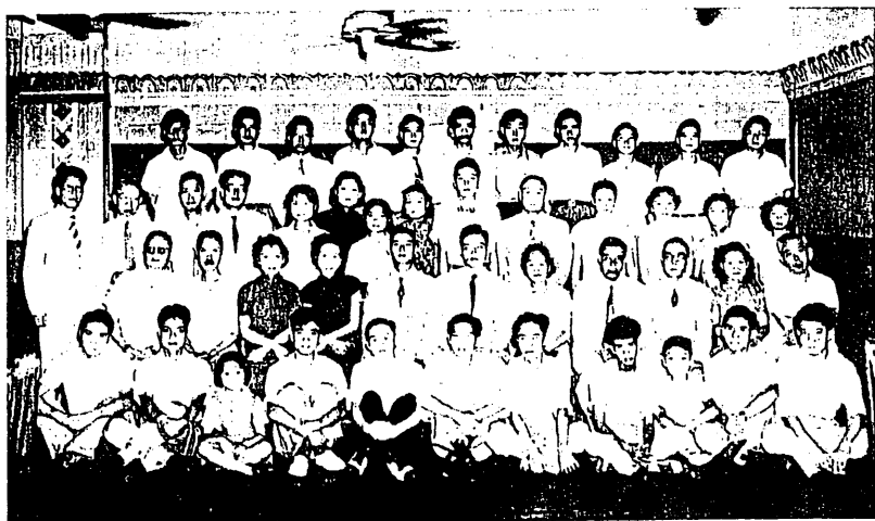
1952 年歡送第一屆新亞書院畢業生全體合影