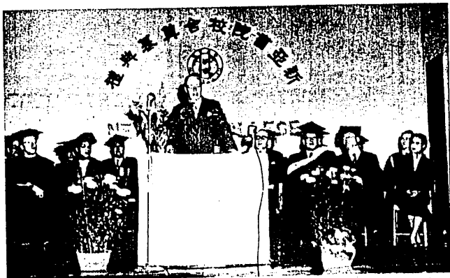
1955 年新校舍奠基典禮港督葛量洪爵士致詞

築惟圖書館佔地最大，此最值稱賞者一。課室次之。各辦公室佔地最少，而校長辦公室更小，此值稱者二。又聞香港房租貴，今學校只有學生宿舍，無教授宿舍，此值稱賞者三。即觀彼校舍之建設，可想此學校精神及前途之無限。余曰，君匆促一巡視，而敝校所苦心規劃者，君已一一得之，亦大值稱賞矣。