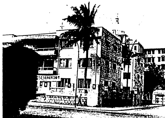
1955年新亞研究所初創時在太子道之校舍

民國四十三年（1954）秋季，新亞自得雅禮協款，即在嘉林邊道租一新校舍，較桂林街舊校舍為大，學生分於嘉林邊道及桂林街兩處上課。雅禮派郎家恒牧師來作駐港代表。余告以雅禮派君來，君之