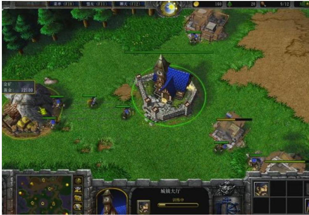
Warcraft III The Frozen Throne 20

祖，2003 年出現的 Dota 於網吧在縣城開始出現的時間基本吻合。如果說當今 MOBA 遊戲的流行確實顯示出一種對現實社會的映射關係，那麼網吧及其承載的電子遊戲這一文化商品，或多或少確實以某種形式參與到了對新自由主義、計算理性的擴散和翻譯之中。