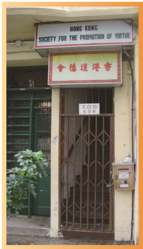
位於西環太白臺的香港道德會福慶堂