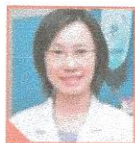
資料提供： 註冊營養師張可琪