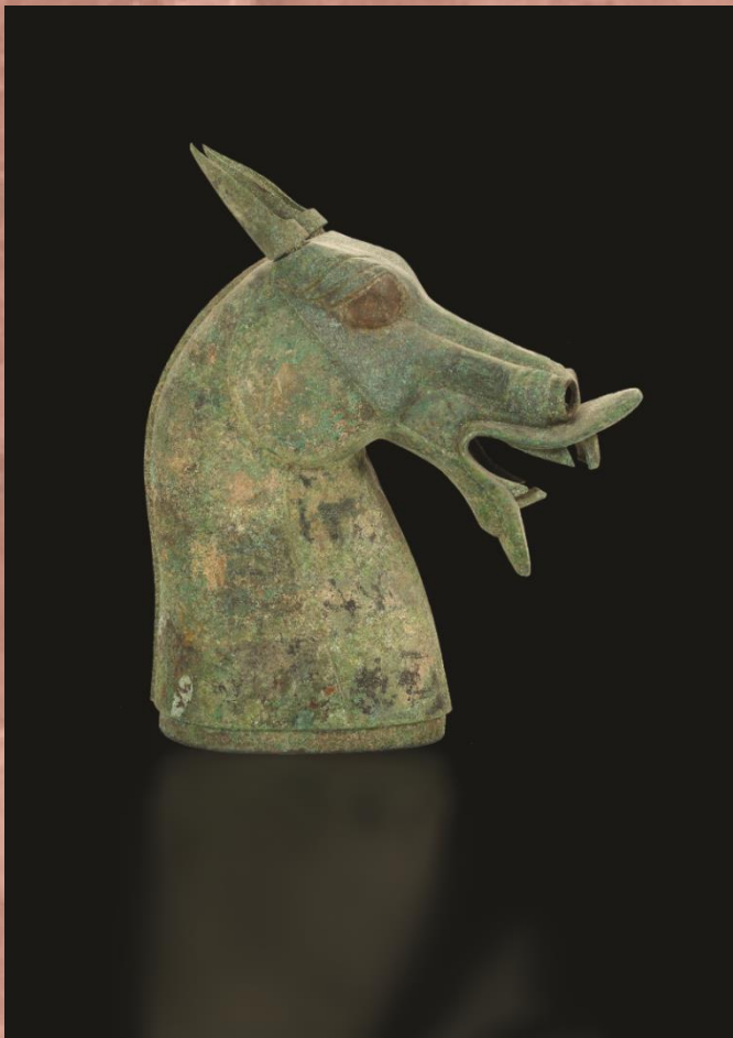
青銅馬頭 東漢·二世紀