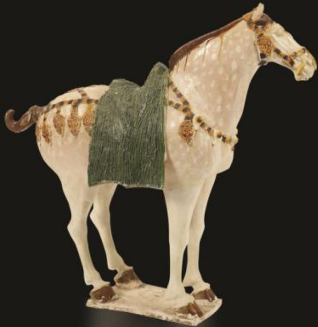
三彩鞍馬 唐·八世紀上半葉