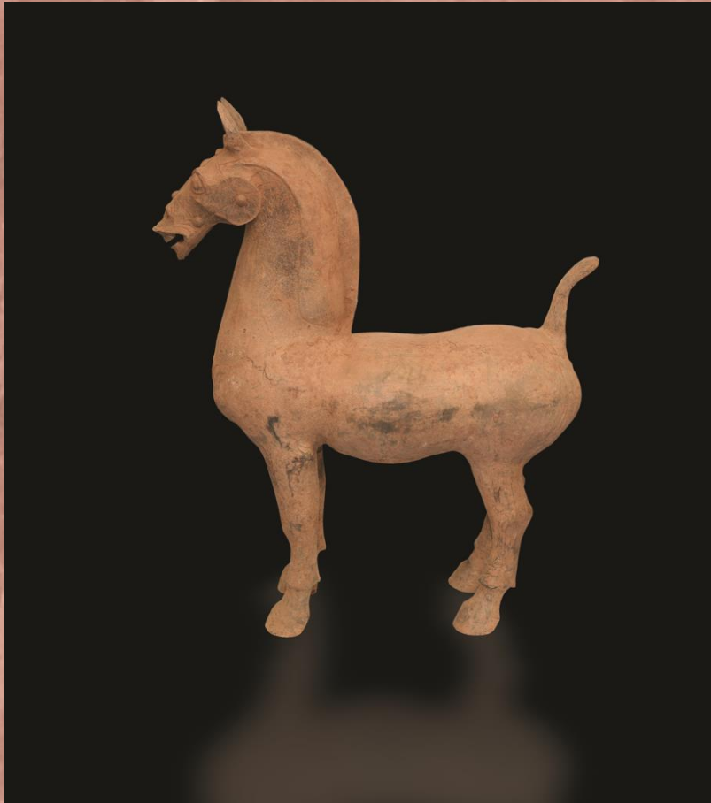
灰陶立馬 東漢·二世紀