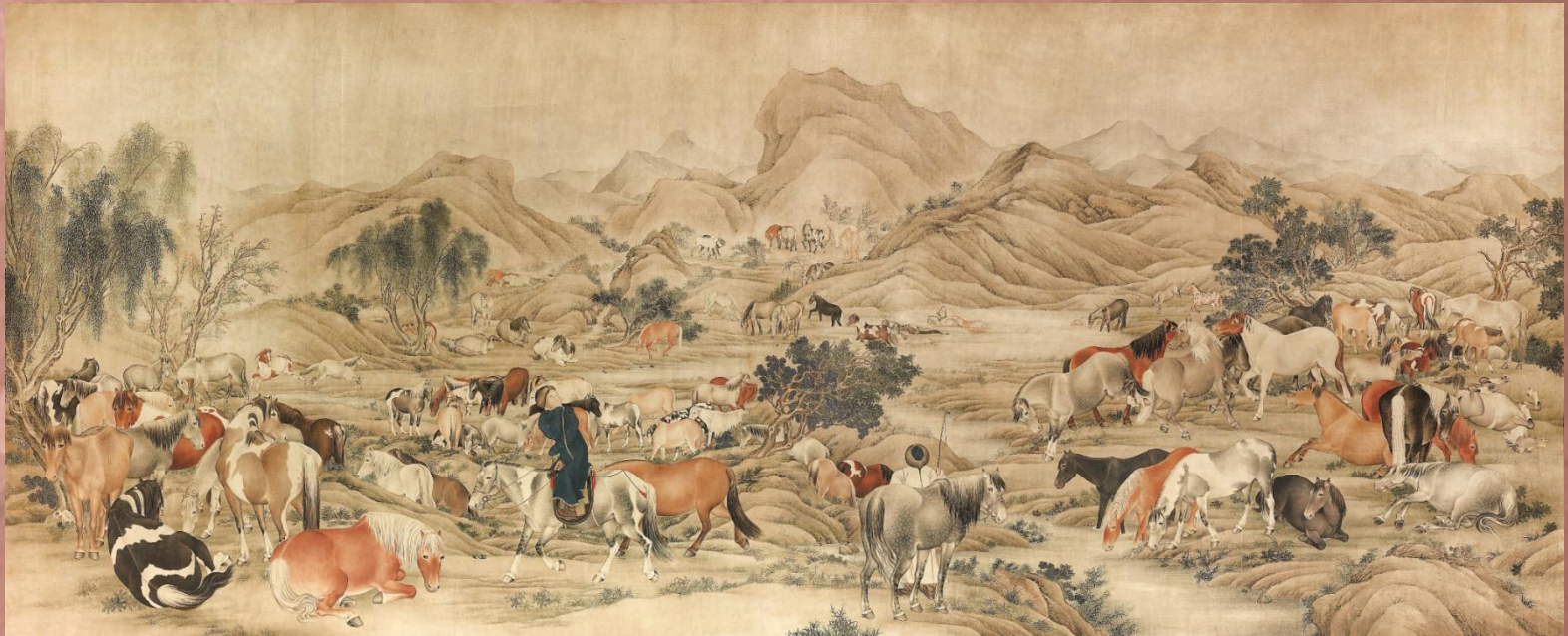
佚名 百駿圖 清·十九世紀