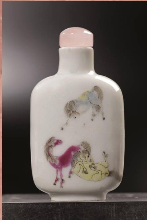
粉彩穆王八駿圖鼻煙壺 清·道光 (公元1821-1850年)