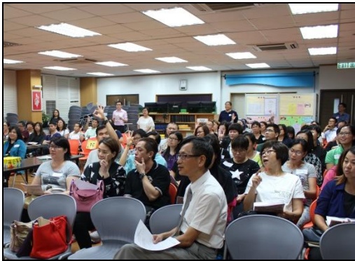
圖 12 至 15：家長工作坊——課外時間支援學生建立自主學習習慣及技巧