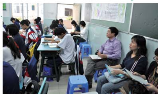
▲團員在暨大附中聽課