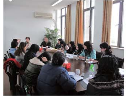
▲上海團員觀課後座談