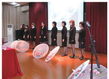
▲團員參與建平實驗小學教師誦讀比賽活動