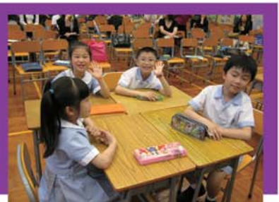
▲ 參與教學演示的學生