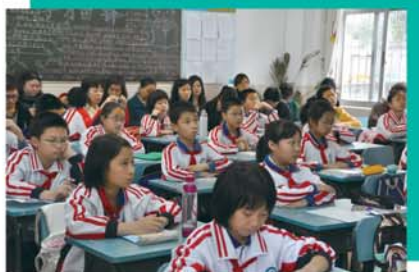
▲ 交流團學員在廣州暨南大學附小觀課