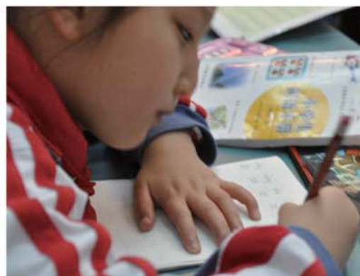
▲暨大附小學生上識字課