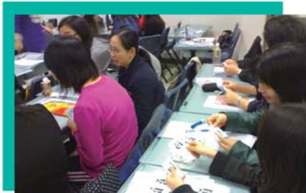
▲ 學員在研習課上做拼音遊戲