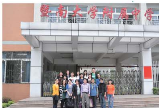
▲廣州交流團團員合影