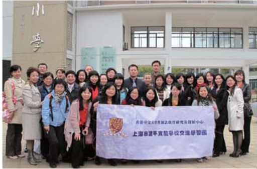
▲上海交流團團員與當地教師合影