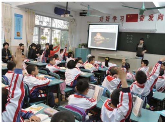
▲團員在暨大附小聽課