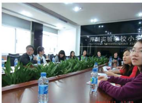
▲ 深圳交流團團員與內地老師座談