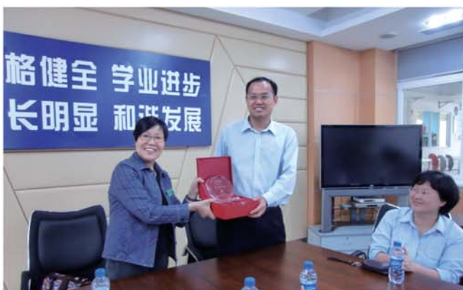
▲ 隨團導師向深圳實驗學校周主任贈送紀念品