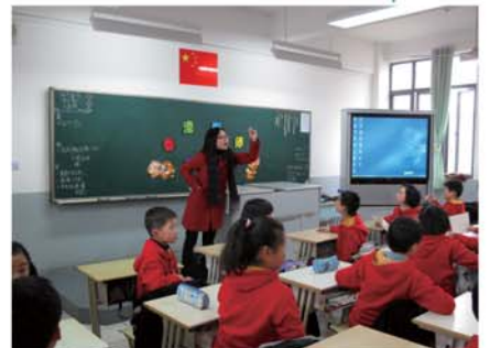
▲交流團團員進班跟學生做活動