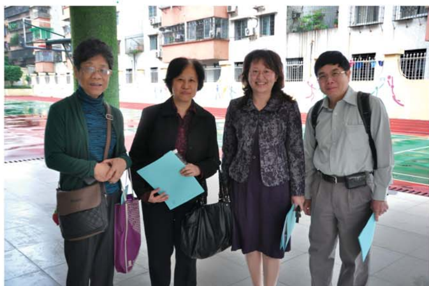
▲隨團導師跟廣州暨大附小校長合影