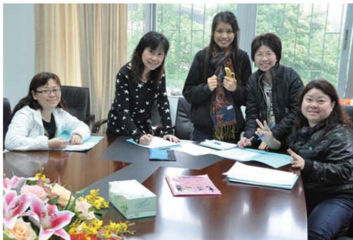
▲學員在座談會後作小組分享