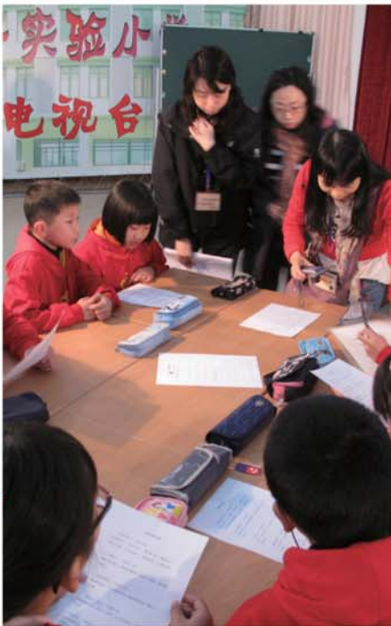
▲學生進行小組活動