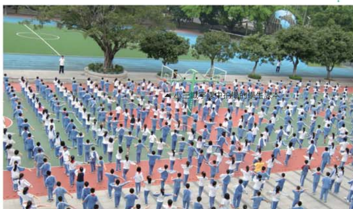
◀ 小三級字課中拍攝的學生課本