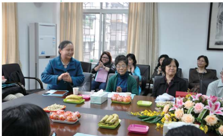
▲暨大附小課後交流會