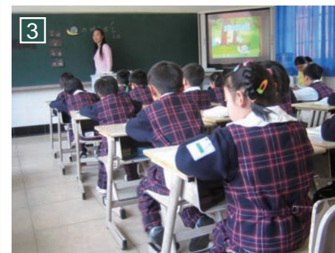
▲教師對教學內容的駕馭及教學技巧的運用，讓學員耳目一新。