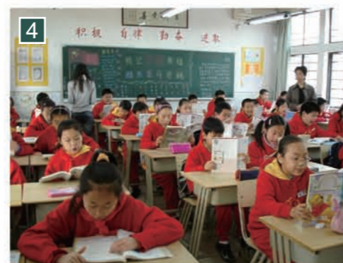
▲學生自小養成良好的行為規範，上課前，學生自讀課文，作為課前的準備。