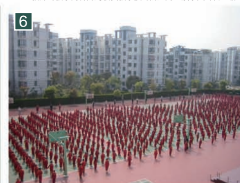
▲每天，學生都進行課間千人廣播操。