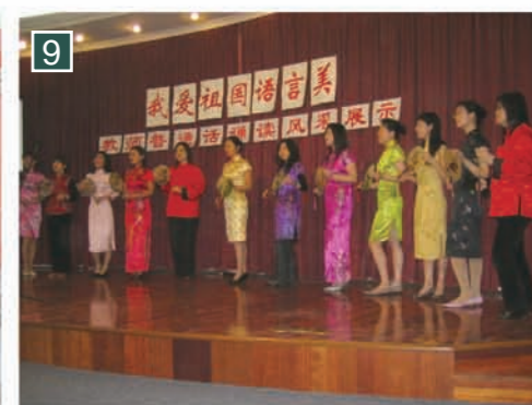
▲參與每年一度的基本功大賽——普通話語讀比賽，與上海教師共同表演。