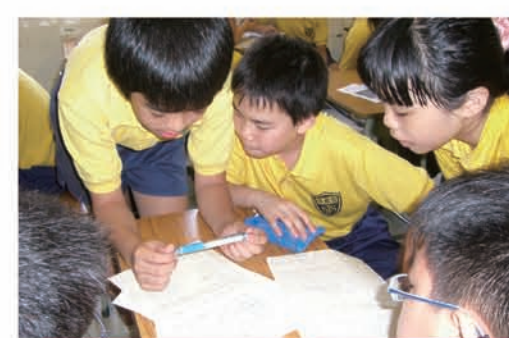
學生第一次寫散文，進行小組共同修改，然後再撰寫。