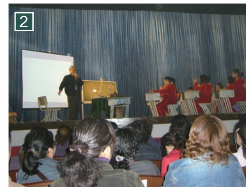
▲觀摩全國特級教師于永正老師的作文公開課。