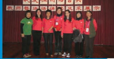
李老師與上海教師一起參與教學活動

這次上海交流經驗的體會與校內實踐，不但令我對內地教育加深了認識，亦讓我的語文教學觀念得到更新，深切體會到普通話教中文的可行性和它帶來的震撼，還使我體驗了教學的藝術。