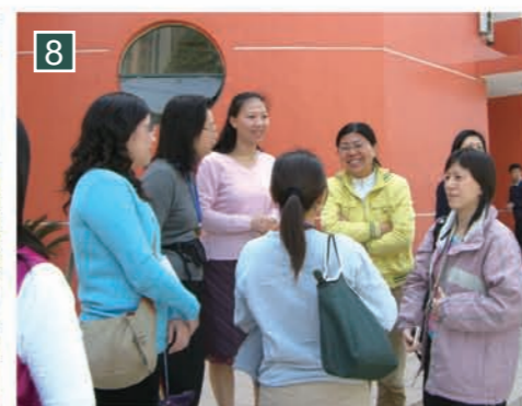
▲訪問區內另一小學，與學校的教師交流。