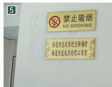
▲校園內貼出告示，提醒學生用普通話作交際語言。