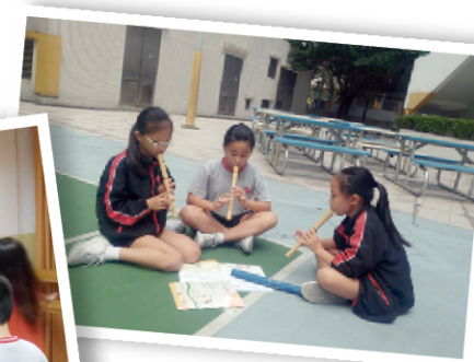
● 學生正在練習樂器及唱歌，為長者表演作準備。