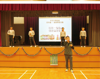
● 學生在進行服務活動前，先上課學習有關精神。