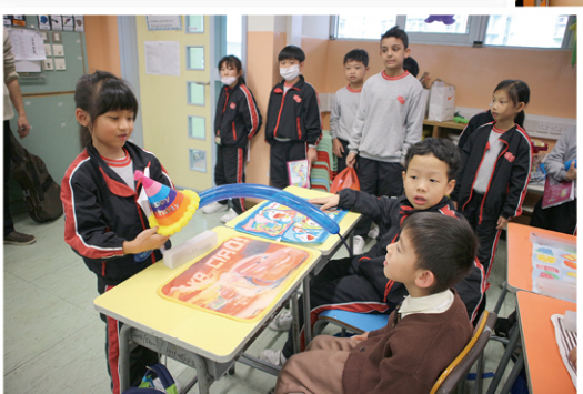
● 學校將服務學習結合常識科，讓二年級同學為鄰班同學舉行生日會，領略服務精神。

「我們想發展學生的其中一個價值觀是隊工，希望他們在升讀四年級參與服務學習之前，已培養出相關的信念，碰巧二年級常識科中有一個課題是關於好朋友，於是我們便乘機將服務學習融入其中，邀請學生為別班同學開辦生日會，建立推己及人的精神。」周主任道。