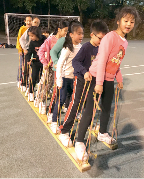
● 歷奇活動讓學生嘗試了很多的第一次。