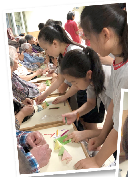
● 學生與長者一起製作手工，又為他們演奏樂器。