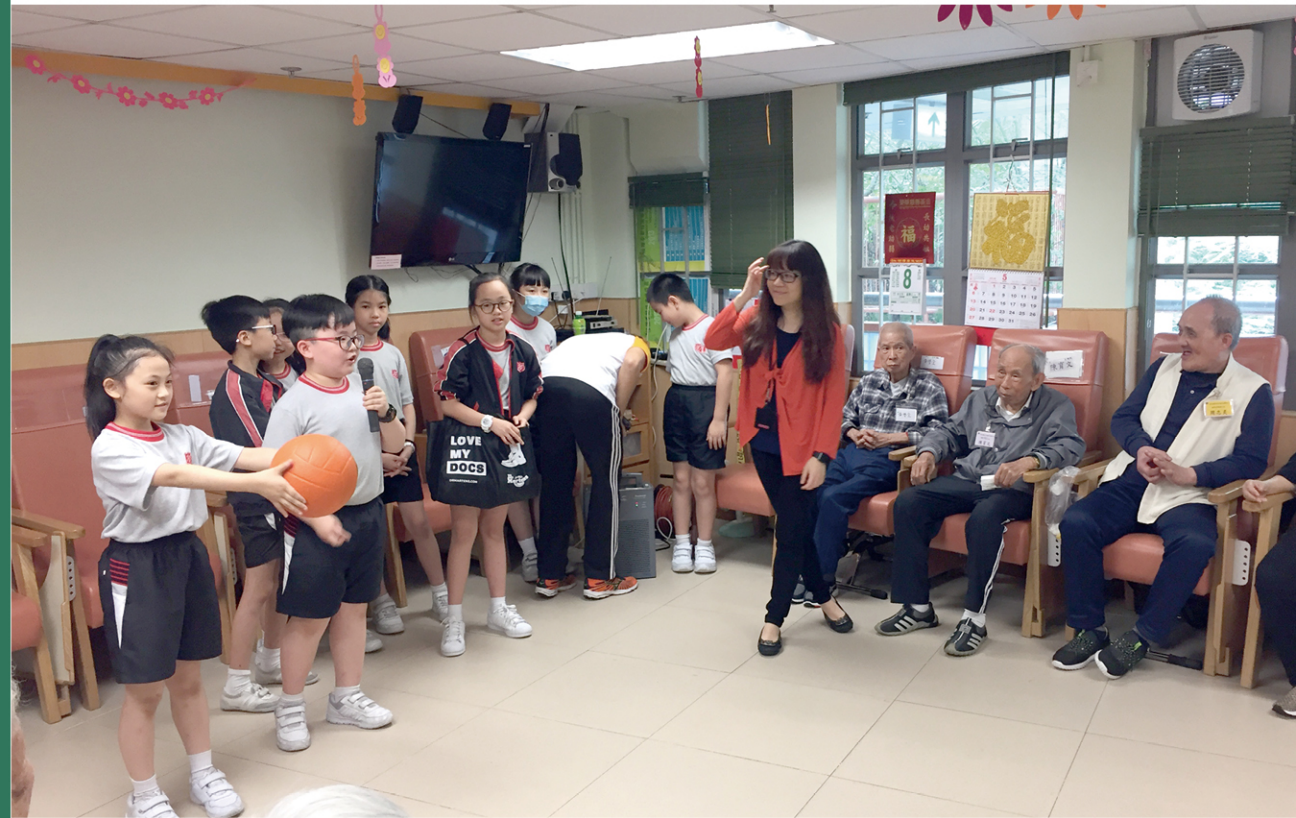
● 學生探訪老人家，並為他們安排遊戲。

救世軍林拔中紀念學校的校訓是「誠信愛勤」，故學校一直有很多服務活動，希望藉之帶出學生的仁愛精神，關顧他人。經年累月下來，學校的服務活動百花齊放，每個小學生都最少一人一職，服務同學、服務學校，但亦因此不夠聚焦。就此，學校引入 QSHK 計劃，重整服務活動的架構，並以「勇氣、隊工及互助」為發展方向，促進學生的全人發展。