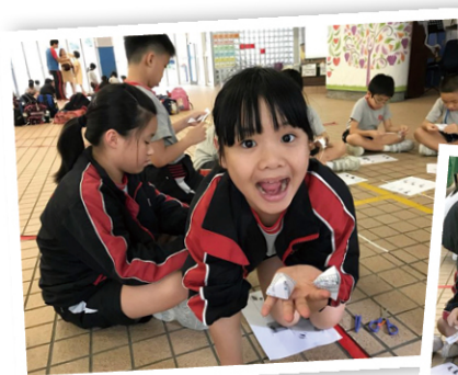
● 學生正在為長者設計遊戲。

「學校要推進服務學習，其中一項要點，便是作為校長要懂得適時放手。何謂適時呢？便是在發展階段到達幾近成熟之際，但又不可等到完全成熟時。中間要留有空間，讓同事自行摸索，碰釘不打緊，最重要是同事認同及認清理念便可。另外，大家是否擁有共同夢想亦很重要，因為人總有緣聚緣散之時，若大家擁有共同目標，即使人事上緣已盡，計劃也能由其他人繼續執行下去。」校長勞耀基說。