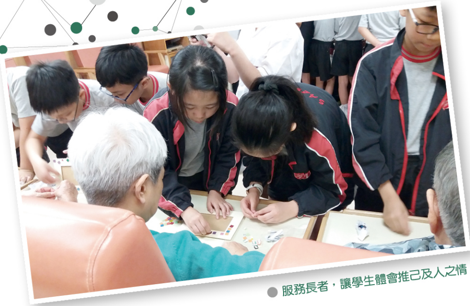
● 服務長者，讓學生體會推己及人之情。

「在與老友記一起做手工時，看到老友記們那麼投入、那麼開心，很有成就感。老友記那興奮的笑容，讓人難以忘懷，從中首次感受到助人的快樂及意義。」