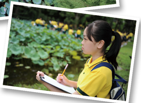
● 同學在荷花池寫生，為之後的水墨創作作準備。