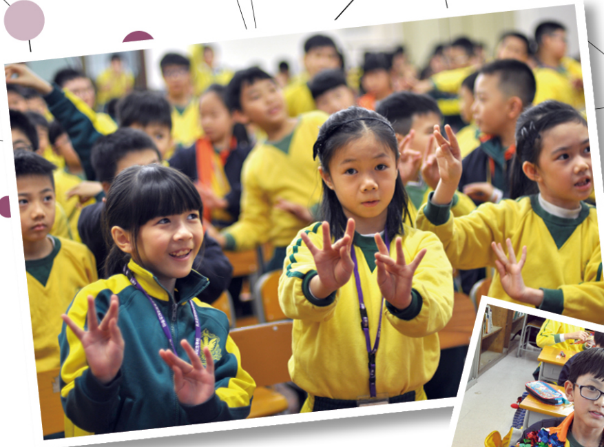
● 學生學習粵劇做手及傳統花牌的製作。