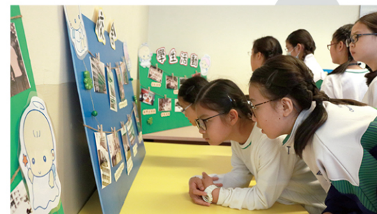
● 學生正在觀賞昔日校園的照片。

「我們要拍攝在學校的難忘事，自己撰寫劇本並演出。起初要訪問校友姨姨時，心情異常緊張，不知怎樣問才好；又不懂得拍攝及剪片。」