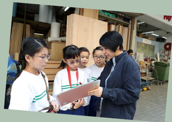
● 老師帶領學生前往社區考察。