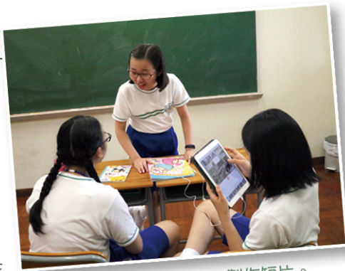
● 同學正在學習使用 iPad 製作短片。