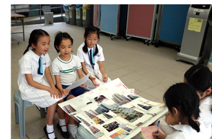
▲▼ 完成探究後，學生向其他同學匯報成果。

拍攝短片的過程中，學生遇到不少困難，例如如何與同學合作？如何構思意念？如何運用鏡頭呈現心靈？組員間各有各的意見，有時你一言我一語，有時低頭密密細斟，最後大家達成共識，攝製了一輯情感豐富又別具美感的水準之作。