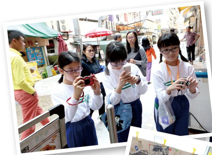
● 學生到社區進行探究，並把觀察所得，以拼貼畫形式表達。

「我們一直把社會參與局限在服務的範疇，但今次活動不但發掘到學生在藝術方面的潛能，還發現讓學生探知社區，可增加她們對社會的關心，這也是社會參與的開始。」校長區敏儀不諱言，學校一直着重智育發展，在社會參與及體藝方面尚有着墨空間，遂希望透過參與 QSHK 計劃，促進學生的全人發展。「我們不是要每個同學也成為藝術家、運動員，也不是每名學生也有這兩方面的天分，我們只想培養她們這方面的素養，在街上看到藝術品也曉得駐足觀賞。」