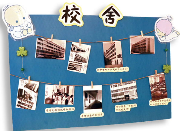
● 同學將昔日校園的資料整理並製成展示板。

全人發展由心、身、靈的成長促成，而心、身、靈的成長則由身邊的人與事堆砌，要牽動學生關懷人文之情，首先就要從她們身邊的人與事入手。