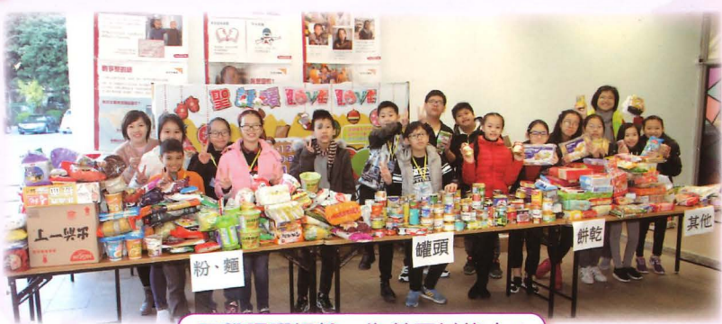
同學踴躍捐輸，為善不甘後人！

由六年級同學擔任「暖Love Love」大使，向全校同學宣傳及推動「聖誕暖 Love Love 捐贈食品大行動」，鼓勵同學樂於與人分享，捐贈食物幫助有需要的人士。