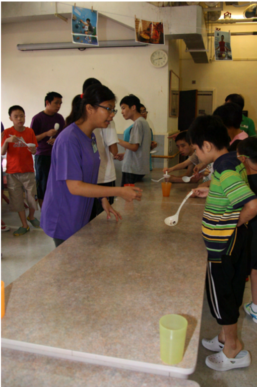
第三組：十人必勝組 遊戲：必勝球