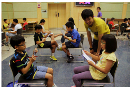
工作坊一：學習溝通的態度及技巧

三節工作坊均是理論與實踐並重，並由大哥姐負責設計及推行；每節均有特定的主題。大哥姐透過遊戲、處境題目、小組討論和實踐學習等活動，讓年幼資優生學懂與人溝通的態度及技巧、學習設計和帶領遊戲活動的技巧，以及明白分工的重要。在第二節工作坊中，更邀請了東華三院徐展堂學校宿舍的社工到場，介紹義工服務日的對象特質和場地情況，為籌備義工服務作好準備。最後一節工作坊，則由大哥姐協助年幼資優生為義工服務日籌備及設計遊戲活動，藉此讓年幼資優生深化和實踐所學的知識和技巧。