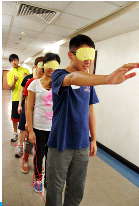
朋輩輔導員正接受培訓