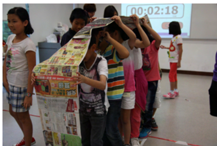
工作坊三：認識帶領活動技巧和籌劃義工服務活動