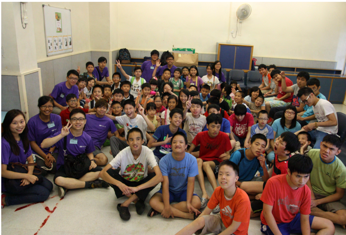
學員與服務對象開心地合照

為讓資優生了解弱勢社群的需要，從而學懂珍惜所擁有的。今年的義工服務安排到東華三院徐展堂學校宿舍服務約五十位中度智障人士。參與的年幼資優生及大哥哥均與服務對象共進午膳，作初步認識；然後，四組的年幼資優生分別在不同的房間，帶領服務對象參與他們設計的遊戲。最後，學員與服務對象一同合唱兩首歌曲—— Stand by Me 及《明日恩典》，代表著大家無分彼此，互相支持，更會珍惜眼前相聚的機會，寄望日後再重遇。學員透過親身帶領小組設計的遊戲，既發揮了小組合作精神，也實踐了工作坊所學的知識和技巧，更為院舍中的服務對象帶來歡樂。