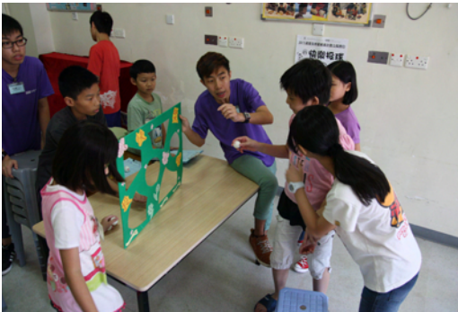
第一組：Central Power 遊戲：快樂投球