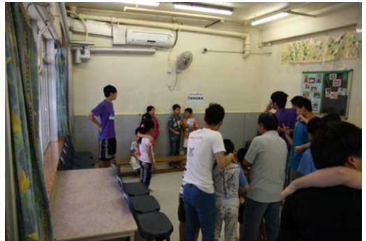
第二組：團結合作第二組 遊戲：新版紅綠燈