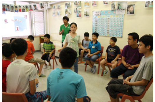
第四組：四葉草 遊戲：大風吹