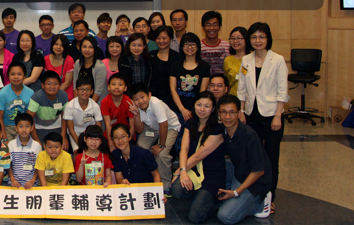
「2013資優生朋輩輔導計劃」的參加者、家長及資優計劃職員於開幕禮中合照

資優學生雖是獨特的一群，但在成長過程中亦跟其他學生一樣會遇到各種各樣的困難，包括情緒管理、人際溝通等問題。如何協助資優學生接納自己的獨特性和發展所長，同時讓他們學懂欣賞別人、善於與人溝通合作、發揮各自才能去幫助和服務別人，是資優教育不能忽略的範疇。故此，「資優計劃」在今年七至九月，特地舉辦「結伴同行——2013資優生朋輩輔導計劃」。希望透過是次計劃，讓資優學生在個人與群性發展方面均得到合適的培育和協助。