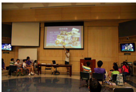
工作坊二：認識服務對象和設計活動技巧