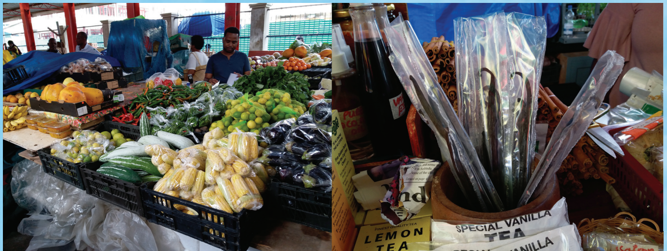
維多利亞市場的貨品琳琅滿目，我買了當地特產的雲呢拿來做手信。