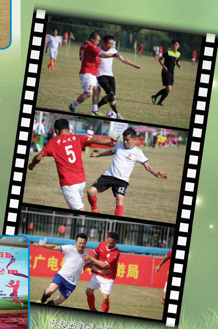
兩天密集式比賽，令每位參賽隊友皆能盡興。