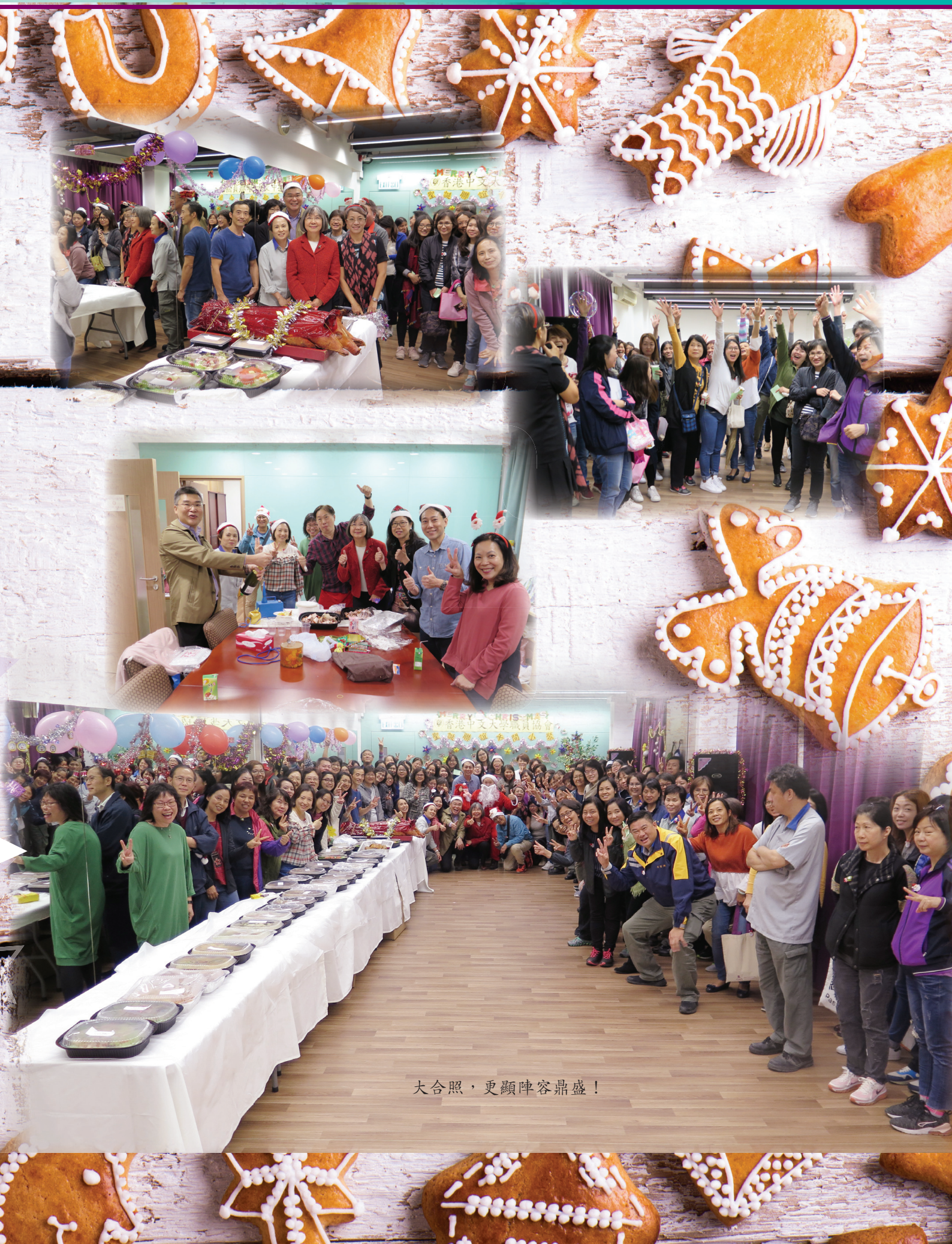
大合照，更顯陣容鼎盛！