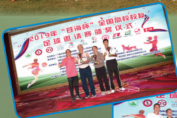
本隊發揮團隊體育精神，獲頒優秀隊伍獎！