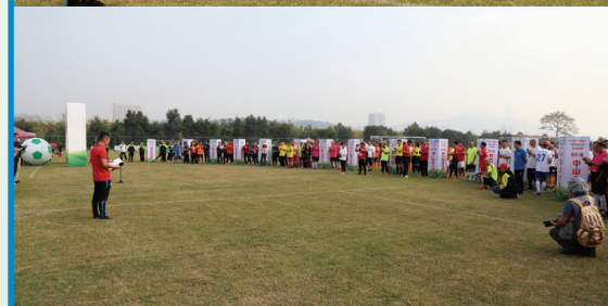
開幕禮於賽前舉行，陣容龐大、非常壯觀。