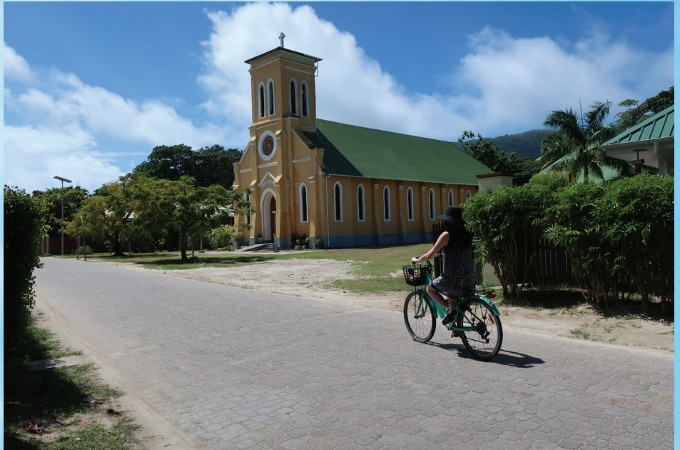
遊客在拉迪格島可踩單車環島遊

在普拉斯蘭島(Praslin Island)小住一晚後，翌日早上轉戰旁邊的拉迪格島(La Digue Island)，船程只需15分鐘。拉島是國內第四大有人居住的島，人口約二千人，以海灘著名。到過塞舌爾的遊客都會說拉島是各個島嶼中最漂亮的，島上有茂密的林蔭和蜿蜒的海岸線。由於島民過去不可擁有車輛，單車成為島上的主要交通工具，另有酒店的高爾夫球車負責接送住客。我們在這個小島過了兩天，自己踩單車去參觀自然保護區和一些小沙灘，旅程雖不算得十分精彩，但難得完全沒有遇到那些嘩鬼旅行團，可以享受恬靜的時刻。