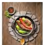
喜氣「羊羊」迎新春特輯