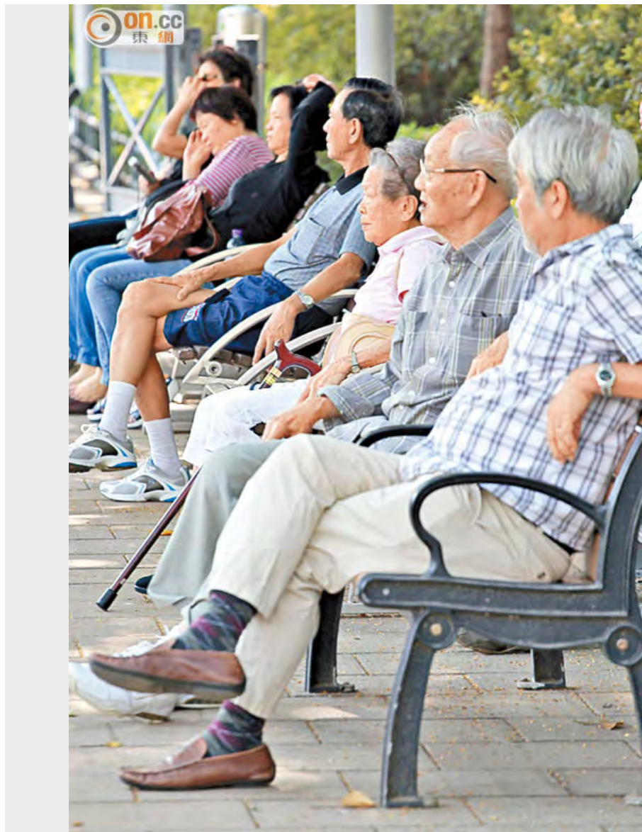
中大醫學院推算本港有逾六萬名患有心房顫動的長者未被確診。(資料圖片)

心口翳悶、心跳紊亂，甚至眼前一黑，都是心房顫動的徵狀，若不及早治療，中風機會可增五倍！中文大學早前進行篩查發現，約百分之七受訪長者屬未曾確診的房顫患者，推算本港仍有逾六萬名房顫長者未被發現，潛藏社區。中大將聯同澳洲悉尼大學進行大型心房顫動研究，為威爾斯親王醫院二萬五千多名門診長者病人進行篩查，並會為確診房顫的長者提供跟進治療；專家稱若推行全港性篩查，每年或可減四百宗中風個案。