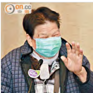
徐婆婆形容，曾經因房顫發作而心跳亂，辛苦得想「撞牆」。