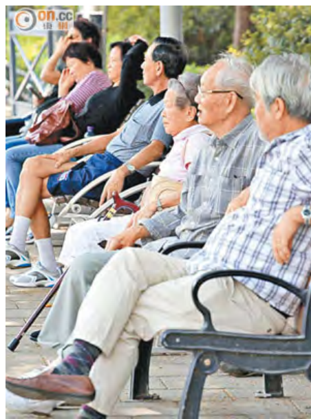
中大醫學院推算本港仍有逾六萬名患有心房顫動的長者未被確診。

中大醫學院在一三至一四年，利用手提心電圖檢測器為一千五百多名六十五歲或以上的長者進行篩查，發現當中一百一十人，即百分之七患房顫，當中僅一人已曾確診，其餘均屬新症，需轉介心臟科；當中一成四病人以往曾中風，兩成人曾有心臟病，發病率高於沒房顫長者。調查又發現，僅百分之七受訪長者聽過房顫，得知該症可致中風的不足百分之五。