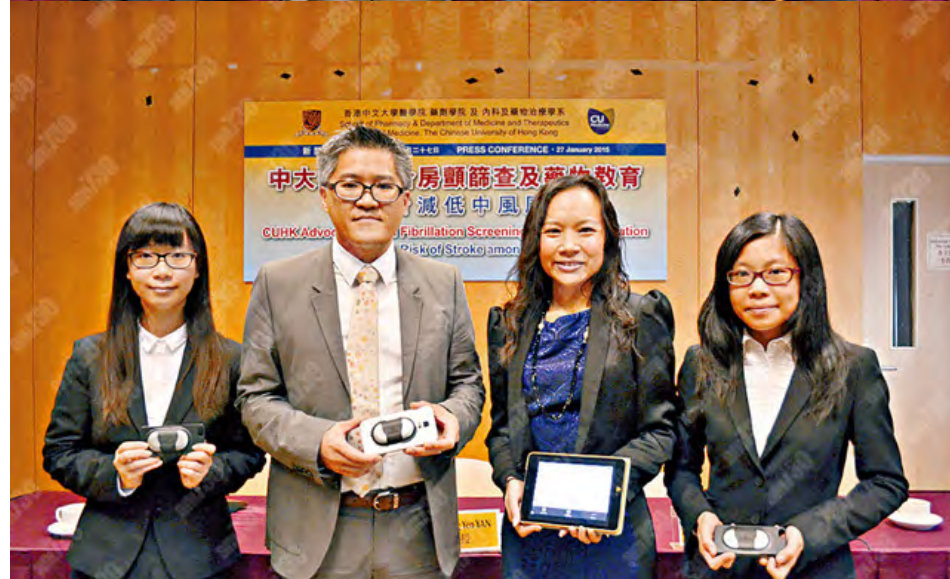
健康, 年齡大風險高 長者對房顛認知低

香港導師協會 - 政府註冊 超過10萬位優質專業1對1上門導師, 為您提供學科補習, 語言, 音樂, 興趣教授。