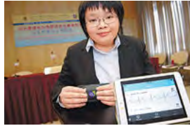
學生義工示範使用手提心電圖檢測器進行房顫檢查。

日報 港聞 中國 國際 地產 財經 體育 副刊 娛樂 專欄 圖片 即時 POPNEWS 熱點圖片 圖說往昔 RSS