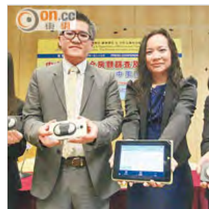
中大將進行更大型的房顫篩查，利用手提心電圖檢測器，為門診長者病人診斷有否房顫。