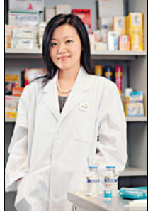
英發現致痛物 重新檢定濕疹膏