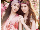
新品介紹: Za T...